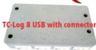
Heat Protection HP250-TC-Log S