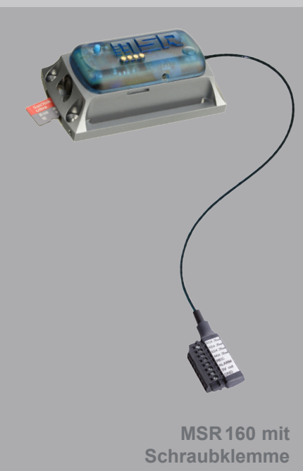
MSR 160 mit Schraubklemme

Vier Analogeingänge, eine hohe Messrate sowie die gigantische Speicherkapazität sind nebst dem kleinen Format die herausragenden Merkmale des Datenloggers MSR 160. Die analogen Eingänge des robusten Mini-Loggers können zum Anschliessen herkömmlicher Sensoren mit analogen Ausgängen (z.B. CO 2 , Leitfähigkeit, PH etc.) verwendet werden. Zusätzlich wird eine geschaltete Speisung zur Verfügung gestellt.