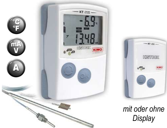
mit oder ohne Display